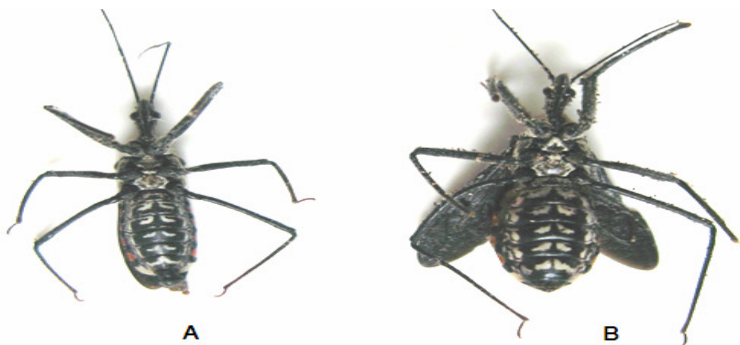
Figure 2 : Ornementation de la face ventrale de Rhynocoris albopilosus . A. Mâle ; B. Femelle