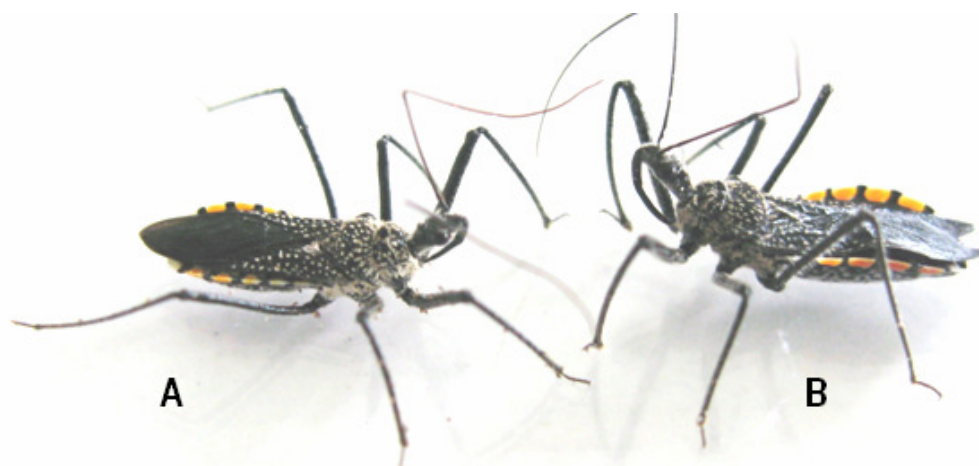
Figure 1 : Ornementation de la face dorsale de Rhynocoris albopilosus . A : Mâle ; B : Femelle

Les moyennes d'une même ligne ayant la même lettre ne sont pas significativement différentes (ANOVA I, test de Fisher)