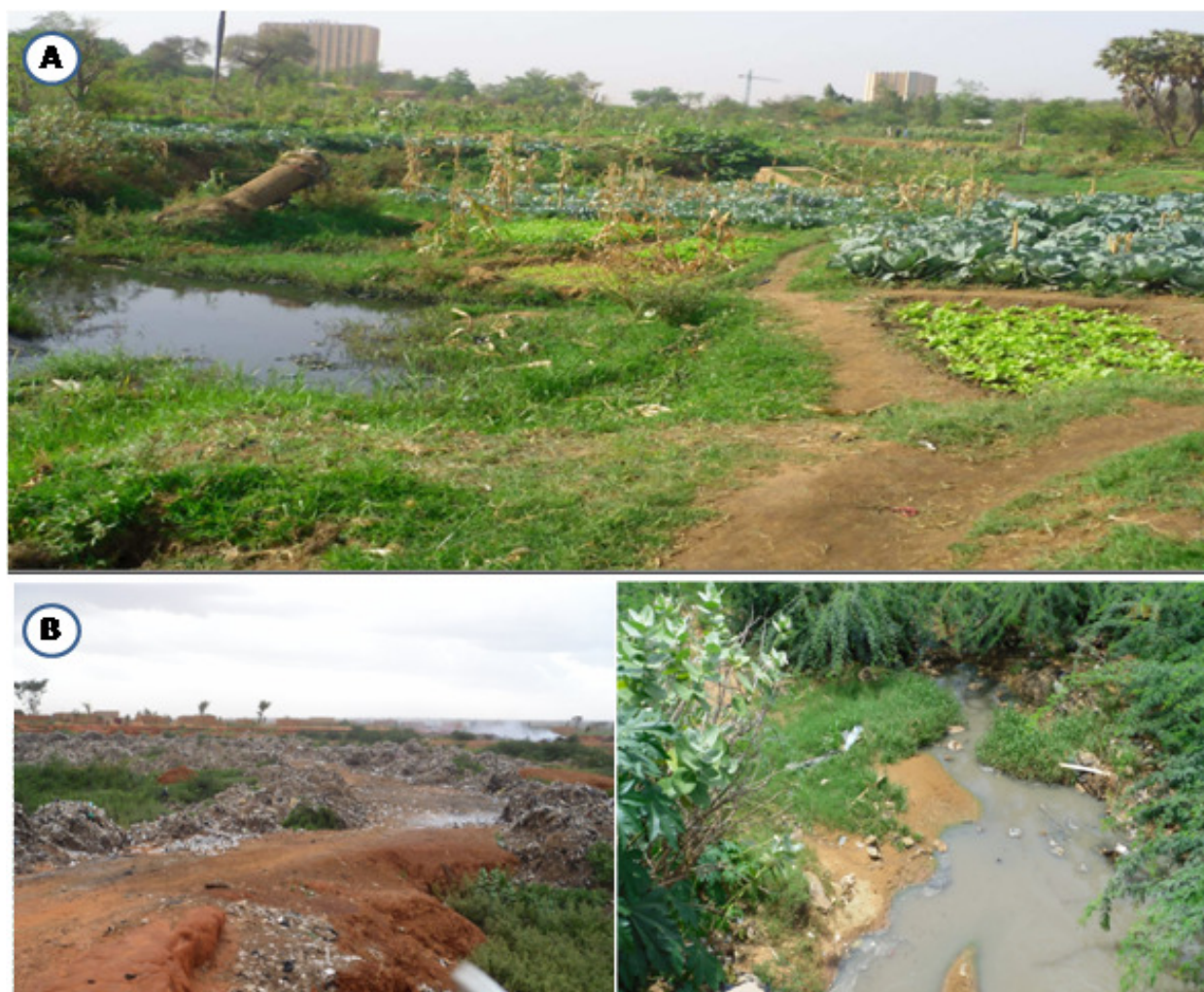
Figure 2 : Description de la vallée de Gounti Yena

A : Vue du site de Gounti Yena avec des cultures de laitue et de chou ; B : Décharges sauvages et caniveau drainant les eaux usées brutes dans la vallée de Gounti Yena.