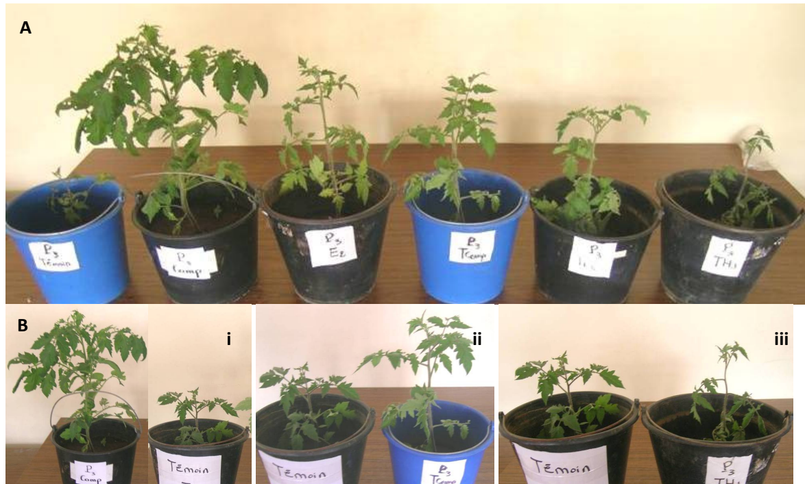
Figure 1 : (A) : Les Symptômes observés sur les plantes de tomate de la variété Campbell 33 inoculées par V. dahliae P3 et ayant subi des traitements par le compost ou l'extrait de compost ou encore l'inoculation par T. harzianum . (B) Comparaison entre une plante témoin non inoculée par P3 et cultivée dans le sol et ; une plante inoculée par P3 et cultivée dans le sol amendé de compost (i) ; une plante coinoculée par P3 et par Tcomp (ii) et une plante coinoculée par P3 et par Tctom (iii).

suite à l'application des différents traitements, en particulier l'amendement de compost dans le sol qui a favorisé la croissance des plantes de tomate (Figure 1A) et a réduit, par conséquent, ces deux indices.