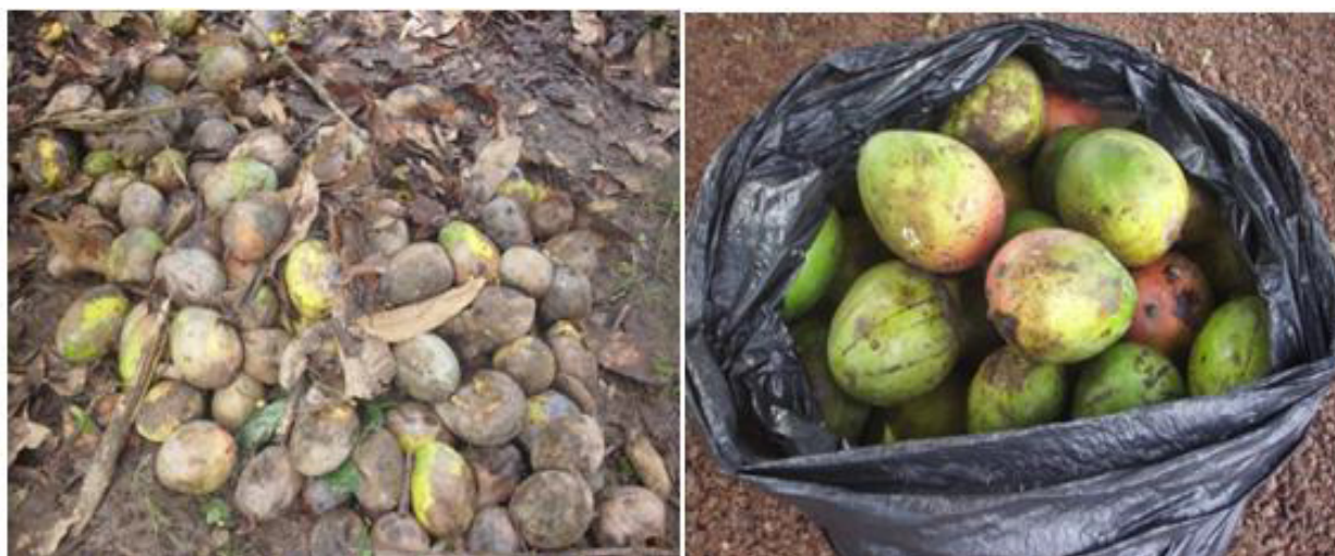
Figure 1: Ramassage et destruction des fruits tombés (2012)

Les fruits piqués et tombés au sol sont collectés 3 fois par semaine et enfermés dans des sacs plastiques noirs hermétiques (sacs poubelle de 80 cm x 50 cm). Ces sacs plastiques noirs sont exposés au soleil pendant trois (3) jours (Figure 1).