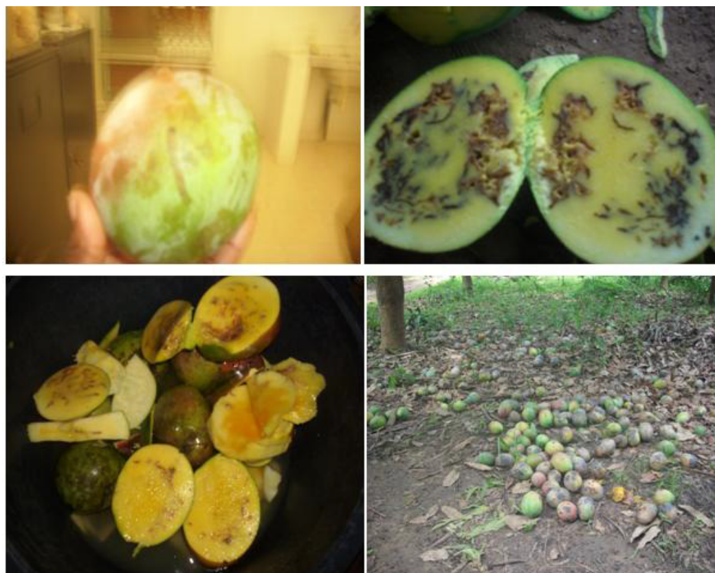
Figure 3: Les attaques des mouches de fruit sur la mangue (2012)

Témoin, l'utilisation des traitements au GF-120 plus Prophylaxie, Prophylaxie et GF-120 ont permis de réduire le taux d'infestation par les mouches des fruits respectivement de 42%, 35% et 19%. L'observation des piqûres sur les mangues suivie de la dissection de ces dernières, ont permis de mieux apprécier la nature des dégâts et d'observer de façon non ambigu la présence des asticots. Les conséquences des piqûres ainsi que l'aspect des dégâts des mouches de fruits sont illustrées sur la figure 3.