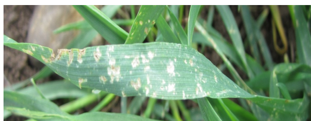
Fig. 4 : Symptômes de l'oïdium due à Erysiphe graminis