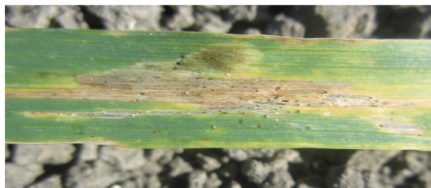
Fig.1 : Symptômes de la tache septorienne due à Septoria tritici