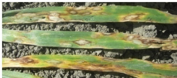
Fig. 3 : Symptômes de la tache bronzée due à P. tritici repentis