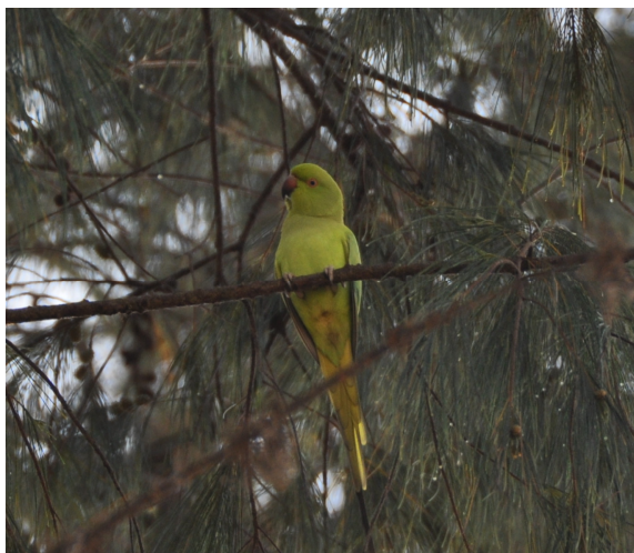
Figure 1c. Perruche à collier Psittacula krameri