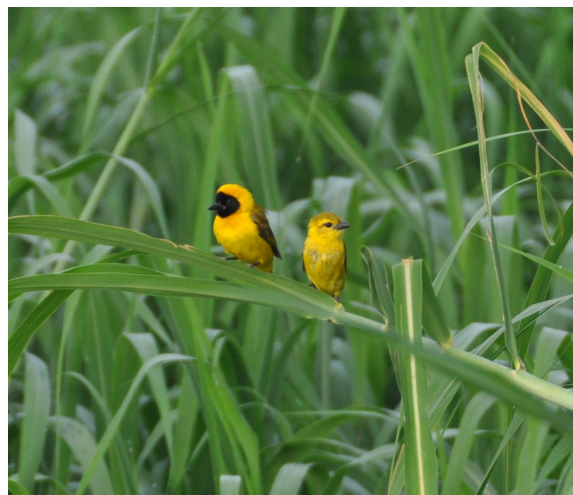
Figure 1f. Tisserin de Pelzeln Ploceus pelzelni

Figure 1 : Images de quelques espèces d'oiseaux rencontrées dans la zone humide d'importance internationale de Grand-Bassam