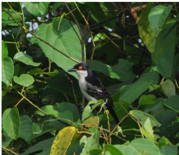
Figure 1e. Cubla de Gambie Dryoscopus gambensis