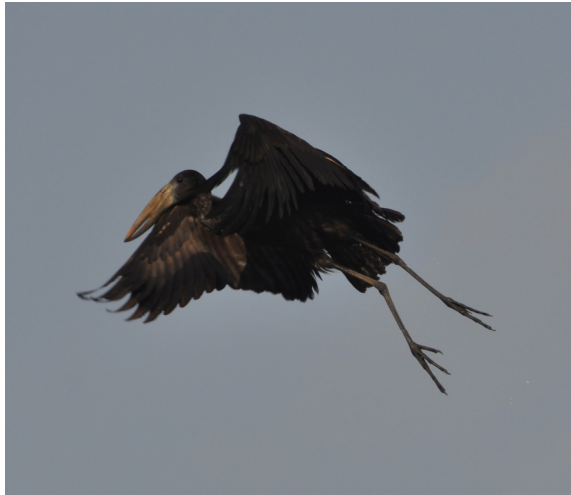
Figure 1a. Bec ouvert africain Anastomus lamelligerus