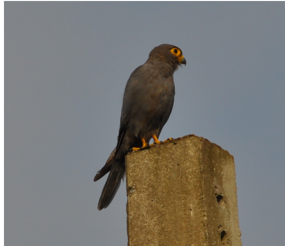
Figure 1b. Faucon ardoisé Falco ardosiaceus