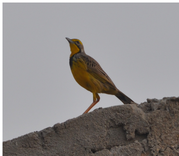
Figure 1d. Sentinelle à collier Macronyx croceus