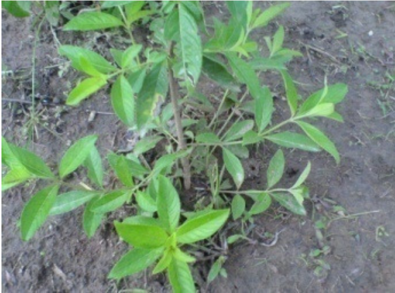
Figure 3 : Jeune plante avec des rameaux primaires

Figure 2 : Différentes populations obtenues par classification ascendante hiérarchique (CAH): C1 : Bouaké, C2 : Niakaramandougou, CO1 Séguéla, CO2 Vavoua, N1 Korhogo, N2 Boundiali, O Touba, NO : Odienné.