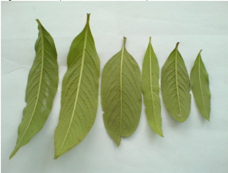
Figure 4: Les formes de feuille de L. multiflora en condition expérimentale.