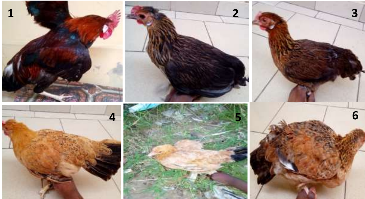
Araucana (1) Noire à camail doré (2) Saumoné doré (3) Fauve herminé (4) Fauve à queue noire (5) Koklo-yaya (6)