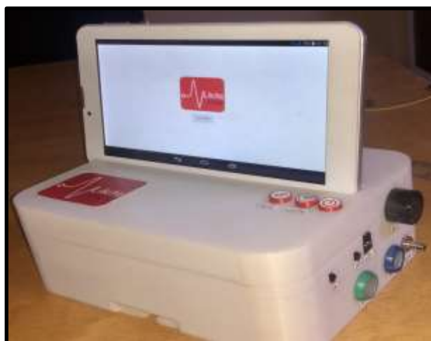
Figure 1 : Moniteur LIKITA-CARE®.

installée sur une tablette. L'appareil a aussi la capacité de se connecter à un réseau Wifi local pour envoyer les données du patient à sa plateforme de surveillance installée sur le même réseau. Ainsi, avec plusieurs appareils LIKITA-CARE® installés sur plusieurs patients, on peut surveiller les constantes physiologiques de tous les patients sur un seul écran ( Figure 1 ).