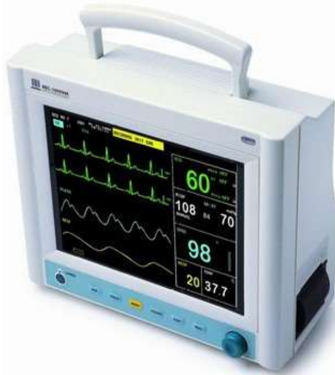
Figure 2 : Moniteur MEC 10 000

diastolique et la saturation en oxygène ont mesurées sur le même patient avec le moniteur LIKITA-CARE® et le gold standard MEC 10000 (AQ-532117660T) de SHENHEN MINDRAY BIO-MEDICAL ELECTRONIC CO.LTD, au service d'anesthésie réanimation de HGR ( Figure 2 ).