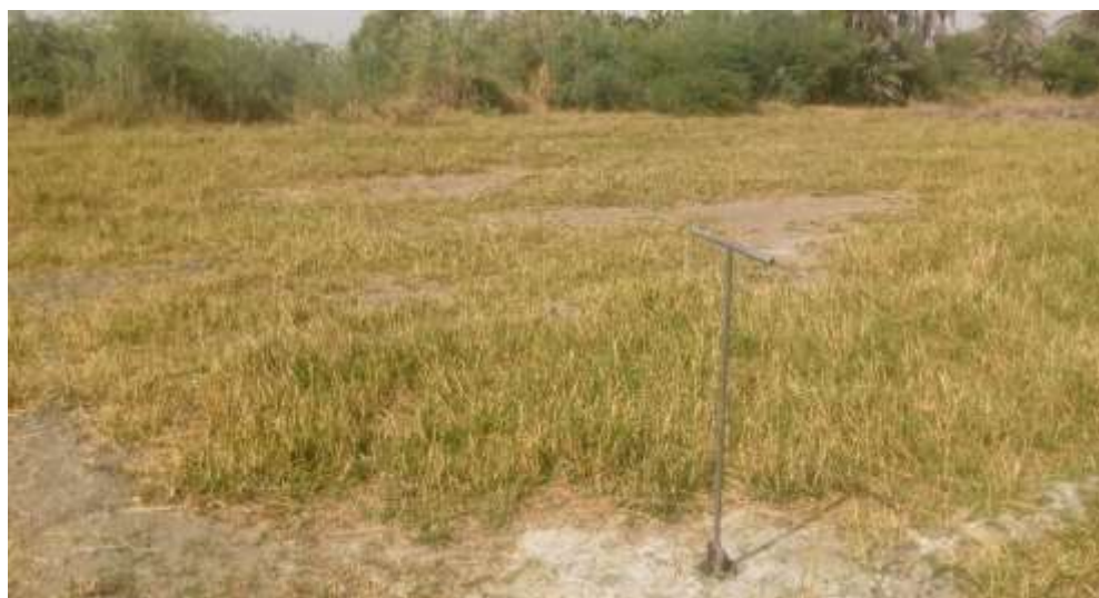
Fig.1. Tarière d'Edelman fixé dans le polder de Mandi en vue d'éventuel échantillonnage de sols dans une parcelle abandonnée

une carte de l'Afrique centrale à l'échelle de 1/200 000e ont été employés, conformément à la méthodologie établie par Mosrin en 1951. Les prélèvements en surface et en profondeur ont été effectués à l'aide de la tarière d'Edelman. Les tests ont été réalisés en utilisant le vinaigre d'alcool, l'acide chlorhydrique et le bicarbonate de sodium. L'utilisation de 250 g de bicarbonate de sodium (NaHCO 3 ) et de vinaigre d'alcool (CH 3 -CO-OH) a permis la détermination du pH des échantillons. Pour l'estimation du calcaire actif, l'acide chlorhydrique (HCl) à 32% d'acidité a été le réactif de choix. Des précautions ont été prises pour éviter toute contamination des échantillons, notamment l'utilisation d'eau distillée et de récipients en plastique dépourvus de toute substance étrangère.