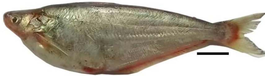
Figure 1 : Spécimen de poisson Schilbe grenfelli Boulenger, 1900 étudié ; Lt = 193,3 mm

Position systématique : Le mot « grenfelli » se réfère à la localité type où l'espèce a été identifiée pour la première fois dans la région de la ville de Boma dans la province du Kongo Central en RD Congo dans la partie inférieure du fleuve Congo (De Vos, 1995). D'après les informations rapportées par FishBase (2023), la position systématique de Schilbe grenfelli se présente comme suit :